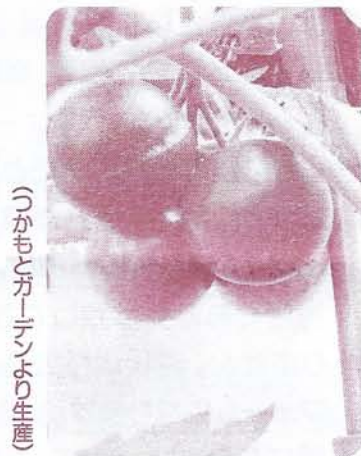
つかもとガーデンより生産