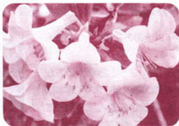
南アジア原産 マレーシアシャクナゲ