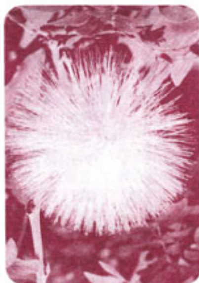
ポリビア原産カリアンドウ

なばなの里へ今年も河津桜を見に行きました。園内には300本のみごとに咲いている桜。ソメイヨシノより開花期も早く、花色は紫紅とかわいく、少し早く春を感じられるので私はこの花が好きです。ワクワクしながら散歩ができる近場でいい所ですよ、なばなの里は。