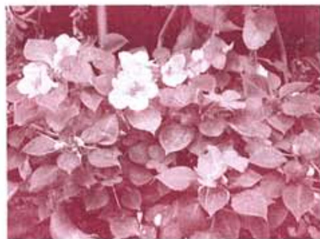
暑さに負けず頑張るインパチェンス