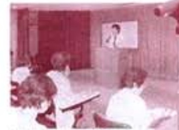
↑京都市地域女性連合会にて