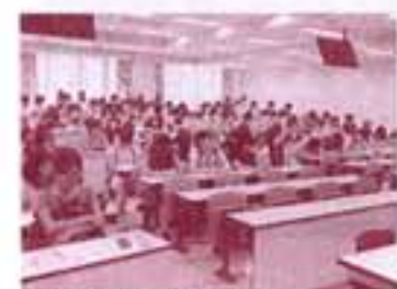
↑京都経済短期大学にて